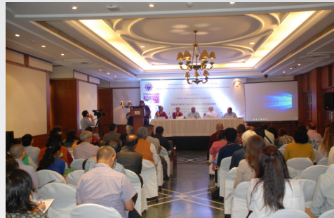
ལུས་སེམས་སྲོག་གི་བརྗོད་མེད་ཚོགས་ཚུན་ཐེངས་བདུན་པའི་སྐབས།