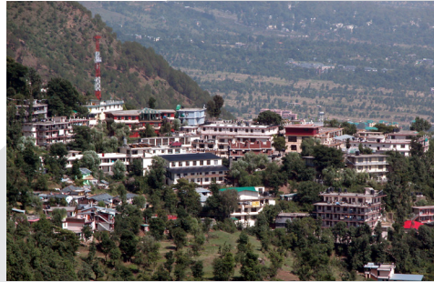
ཚོགས་ལུལ། རྣམ་པུ་ལྷ་བོད་ཀྱི་སློན་ཅིས་ཁང་།