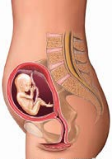
བདུན་སྟག ༡༢ འོན་ལྷོ་གཟུགས་

བདུན་སྟག ༡༢ འོན་ལྷོ་གཟུགས་ དབྱིབས་ནམས་དོད་ལ། མངལ་གནས་ གྱི་གཟུགས་པོ་ཆེ་ཆུང་གིང་ཏོག་པོ་ལྷན་ (passion fruit) ལྟར་ཆགས་ཡོད། བདུན་སྟག་འདི་ནས་གཅིན་པ་ཅུང་ ཅུང་དུ་འགོ་བ་དང་། མའི་མངལ་གྱི་ གཟུགས་དབྱིབས་ཕྱིར་ཅུང་མངོན་ཐུབ།