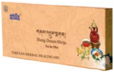
གཞན་འབྱུང་སྐྱེན་པ།