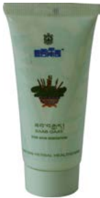
ཟབ་ལག་བརྒྱད་པ།