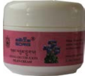
གཞན་འབྱུང་བྱུག་པ།