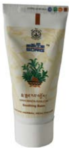
མ་སྐྱེན་རབ་འབྱོར།

གཞན་འབྱུང་ནད་ལ་ཕན་པའི་འབྲུག་སྐྱེན་དང་སྐྱེན་པ། གཞན་འབྱུང་སྐྱེན་ པ་ལ་ཁྱུང་ལྷ་ནི་ལ་རིལ་བུ་གངས་ལྷ་ཞིབ་པར་བཅོས་ཏེ་ཟབ་ལག་བརྒྱད་པ་